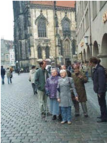
Prinzpalmarkt, im Hintergrund die Lambertikirche