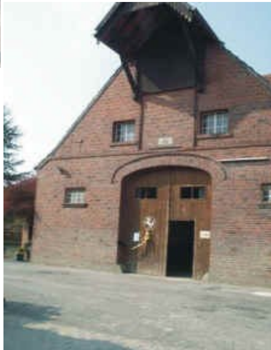
Hof Hövelmann , heute Weilligman gearbeitet