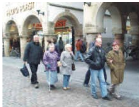
Vor dem Friedensaal in Münster