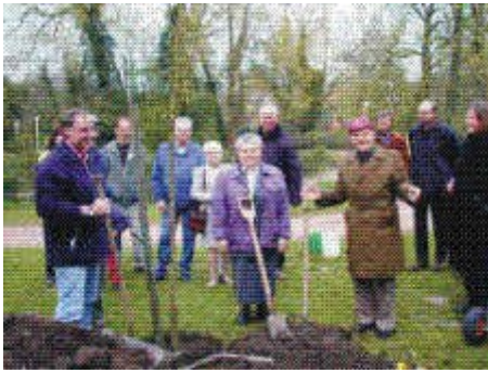
Es ist geschafft, Begegnung im Rodepark in Nottuln